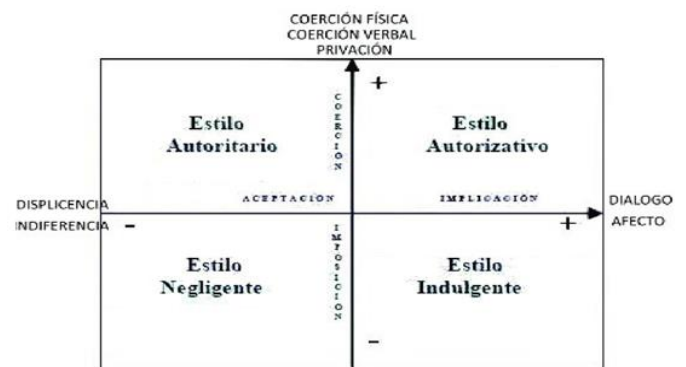
Figura 1. Diagrama de la tipología de la socialización parental.

La tipología de socialización parental se forma a partir del cruce de los dos ejes de socialización y da como resultado cuatro modelos de socialización parental (ver Figura 1).